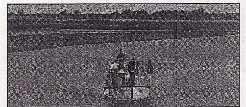
Die oorsese besoekers is op 'n bootrit op die Bergrivier geneem tydens die biodiversiteitswerksessie.

Van die faktore wat die monding negatief beïnvloed, is landboubesoedeling en die grootskaalse onttrekking van vars water vir landboubesproeiing uit die rivier. Die sowat 70 afgevaardigdes het ná besprekings met vier bote op die rivier uitgevaar om die monding van nader te beskou en oplossings vir die gebied se probleem te probeer vind. Die Bergrivier-munisipaliteit was een van die eerste munisipaliteite in die land wat by LAB aangesluit het en die Internasionale Biodiversiteitswerkswinkel wat nou hier gehou is, is 'n uitvloeisel hiervan. “Hierdie stap kan nou vir Bergrivier se gemeenskap vrugte afwerp,” het Liebenberg gesê. “Biodiversiteit maak die tipe ekosisteem waarvan die mens vir oorlewing en lewenskwaliteit afhanklik is, moontlik. Die beskerming van biodiversiteit ter wille van ons gemeenskappe is dus van kritiese belang.”